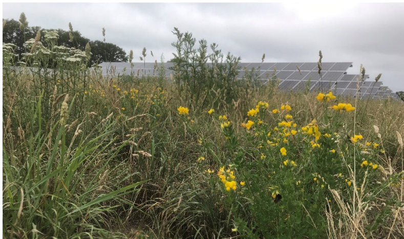
Abbildung 5: Artenvielfalt im Solarpark

Ein auf die Fläche abgestimmtes Beweidungskonzept wird die Artenvielfalt der Flora und Fauna im Vergleich zur vorangegangenen intensiven landwirtschaftlichen Nutzung begünstigen und erhöhen.