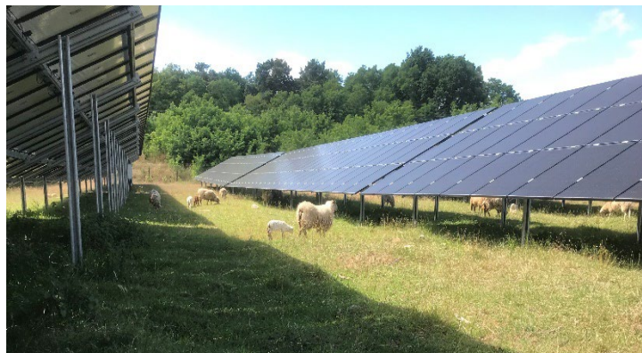
Abbildung 6: Extensive Schafbeweidung im Solarpark

Die Beweidung der Anlage mit Schafen stellt eine effektive und gleichzeitig naturnahe Pflegemöglichkeit dar, um z. B. eine Verschattung der Module zu vermeiden. Die Schafe finden unter den Modulen Schutz vor der Witterung. Durch ihre Tritte schaffen sie bereichsweise offene Stellen, wodurch kleinräumige Strukturen entstehen, welche besonders von konkurrenzschwachen und damit seltenen Tieren und Pflanzen besiedelt werden.