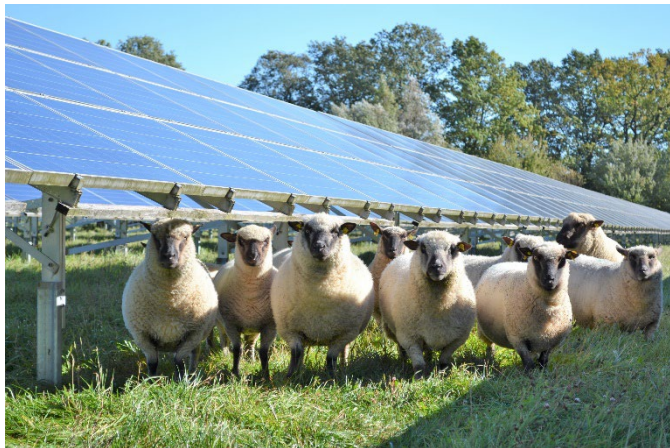
Abbildung 1: Schafbeweidung im Solarpark

Die Pflege der Solarparkflächen soll durch Schafbeweidung erfolgen. Der Vorhabenträger, der derzeit deutschlandweit ca. 400 Hektar Solarparkfläche beweidet lässt, entwickelt hierzu mit dem zuständigen Schäfer ein auf Naturschutz abgestimmtes Beweidungskonzept.