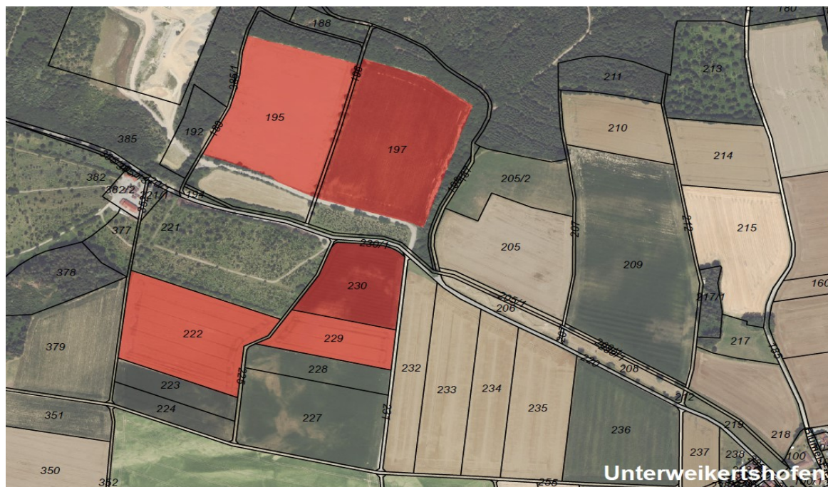
Plandarstellung (nicht maßstabsgetreu)

Der Änderungsbereich hat eine Größe von ca. 14,1 ha und liegt nordwestlich des Unterweikertshofen. Er umfasst die Flurstücke 195 (TF), 196 (TF), 197 (TF), 222, 229 und 230 der Gemarkung Unterweikertshofen. Die Lage und der Flächenumfang sind dem Lageplan zu entnehmen: